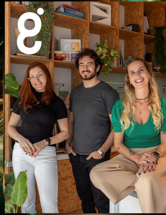
Equipe Estúdio Gente